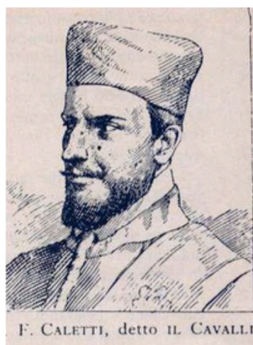
F. CALETTI, detto IL CAVALLI